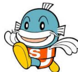
滋賀県イメージキャラクター キャップイー