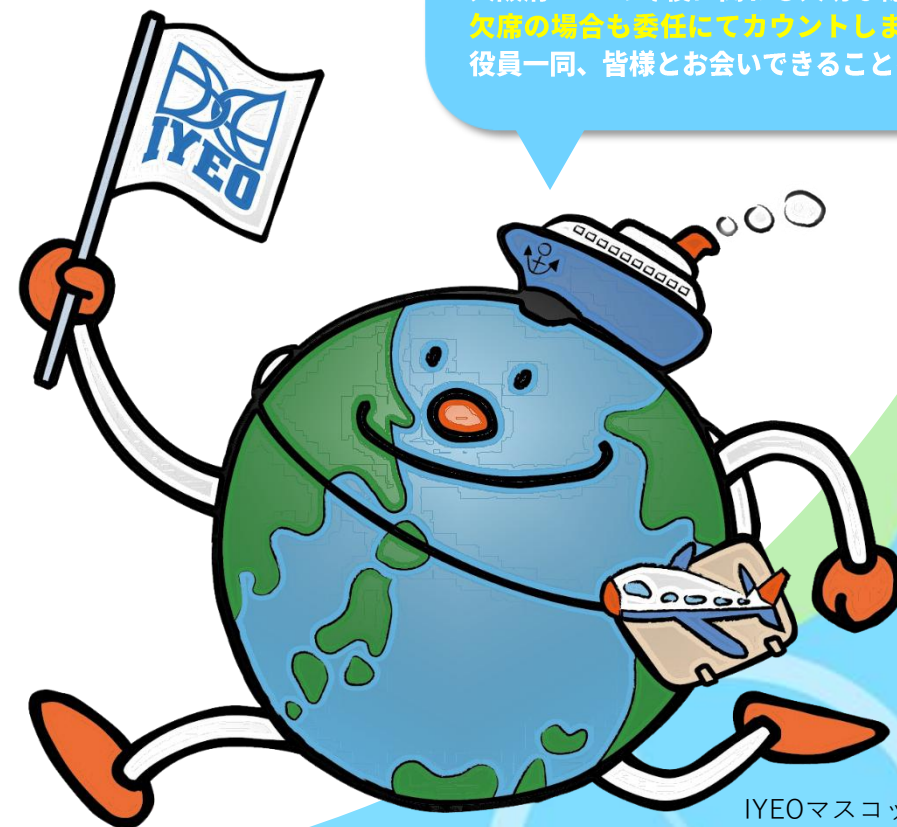
IYEOマスコットキャラクター 「ランナス」

大阪府IYEOの今後に関わる大切な総会です。 欠席の場合も委任にてカウントしますので必ずフォーム送信をお願いします。 役員一同、皆様とお会いできることを楽しみにしています。