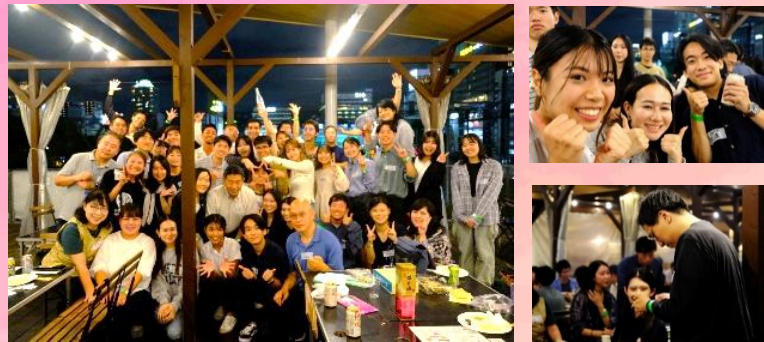
近畿ブロック合同！てんしばでBBQ