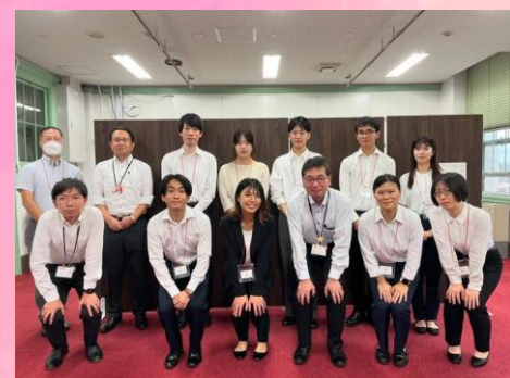
令和6年度内閣府青年国際交流事業 参加青年 大阪府表敬訪問