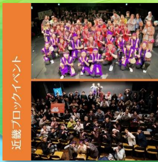
近畿ブロックイベント

青少年国際交流を通して国際社会や地域社会への貢献を考えるついでに近畿ブロックイベント(兵庫県) 開催日: 2025年1月18日 テーマ: 「場づくり×国際交流×地域貢献～関西場づくりサミット～」 場所: Art Theater dB KOBE(兵庫県長田区)