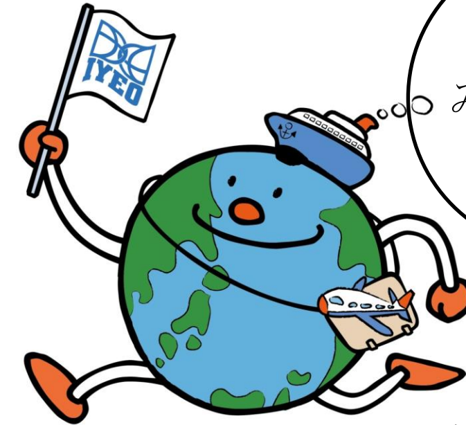
IYEO マスコットキャラクター 「ランナス」